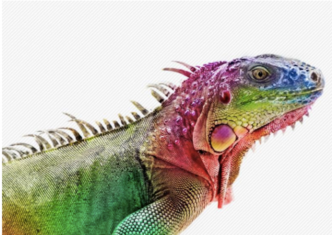
Das :spectrum Ausbildungskonzept basiert auf dem wissenschaftlichen Konstrukt von XLNC Leadership Diagnostic